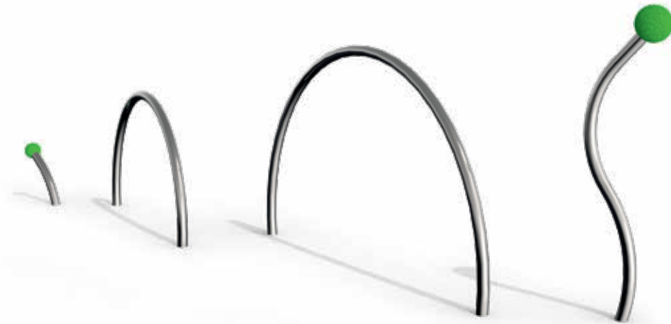
Skizze 1: Gesamtansicht des Spielgerätes