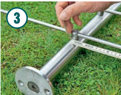
Achten Sie auf gleichmäßige Überstände und ziehen Sie dann die Madenschrauben an den Rundstabhaltern fest.