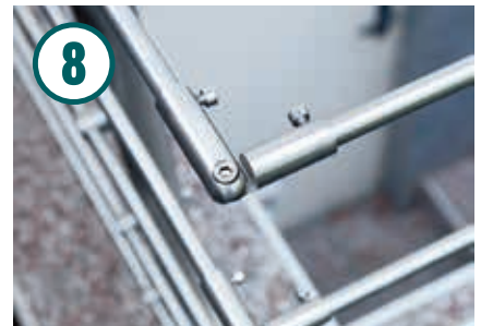
Für die Ecken sind Gelenkverbindungen im Set enthalten. Einfach aufstecken und mit einem Inbusschlüssel festziehen.