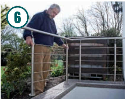
Weitere Geländerteile aufstellen, die Handläufe aufstecken und mit Inbusschlüssel befestigen.