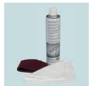
Pflege- und Reinigungsset

Edelstahloberflächen sollten im selben Rhythmus gereinigt werden wie Glasoberflächen. Bei schwächer belasteter Umgebung ist eine Reinigung alle 6 bis 12 Monate ausreichend, bei stärker belasteter Umgebung sollten die Edelstahloberflächen in Abständen von 3 bis 6 Monaten gereinigt werden.