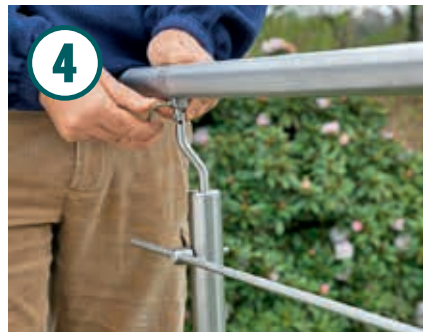
Stellen Sie ein Geländerteil an ungefährender Position auf und befestigen Sie den Handlauf ( \varnothing 40 mm) an den Stützen.