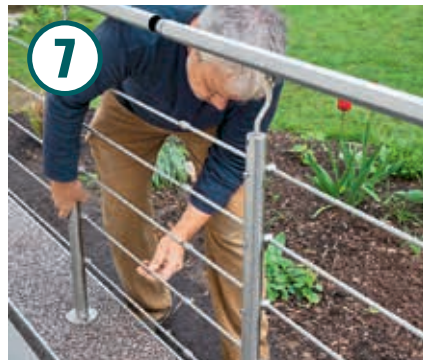
Die einzelnen Geländerteile werden dann untereinander verbunden.