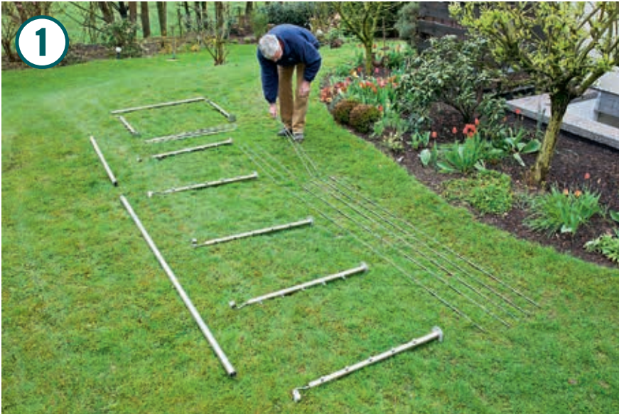
Geländerbauteile entsprechend der Geländerform auswählen und auslegen.