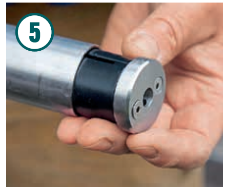
Für den Abschluss des Geländers sind Endkappen im Set enthalten, inklusive Rundstab-Adapter.