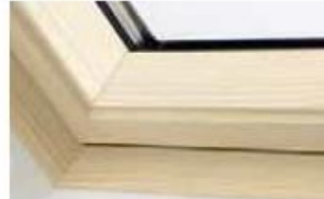
Holz klar lackiert