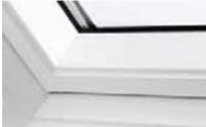
Holz weiß lackiert