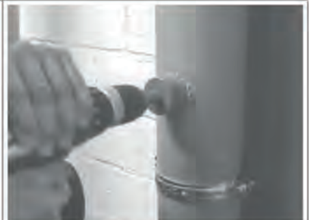
Beim Bohren mit dem beiliegenden Kronenbohrer nur mit leichtem Druck arbeiten, vor allem bei Blechfallrohren.