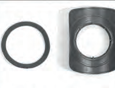
Flachdichtung und Flansch.