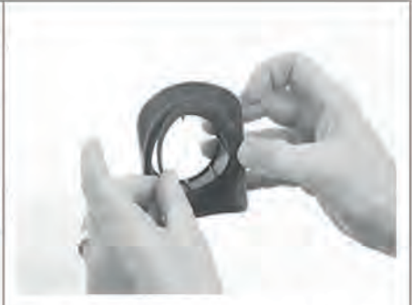
Beiliegende Dichtung in die vorhandene Aussparung einkleben. Dazu Klebefolie entfernen.