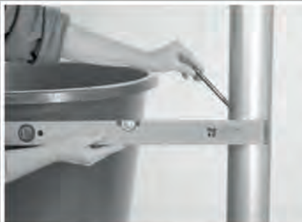
Mit einer Wasserwaage und einem Stift Bohrpunkte am Behälter und Fallrohr markieren

Vor der Montage den Regenwasserbehälter wie geplant aufstellen und dann den maximalen Füllstand des Behälters ermitteln. Die gewünschte Anschlussstelle mit einem wasserfesten Stift kennzeichnen.