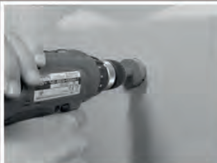
An der Markierung mit dem Kronenbohrer die Öffnung für den Anschluss bohren.