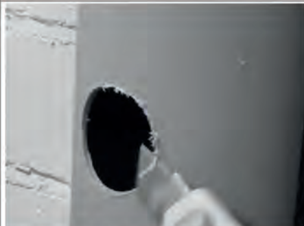
Bei Bedarf Bohrstelle entgraten.