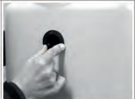
Beiliegende Dichtung DN 19/32 von außen in die Öffnung setzen.