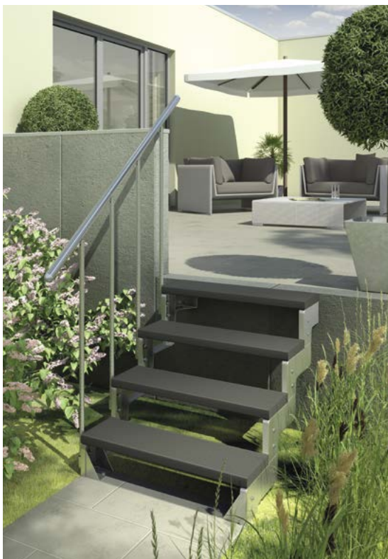
Attraktive, geradelaufende Treppe mit Seitenelementen aus Stahl und verschiedenen Stufenmaterialien