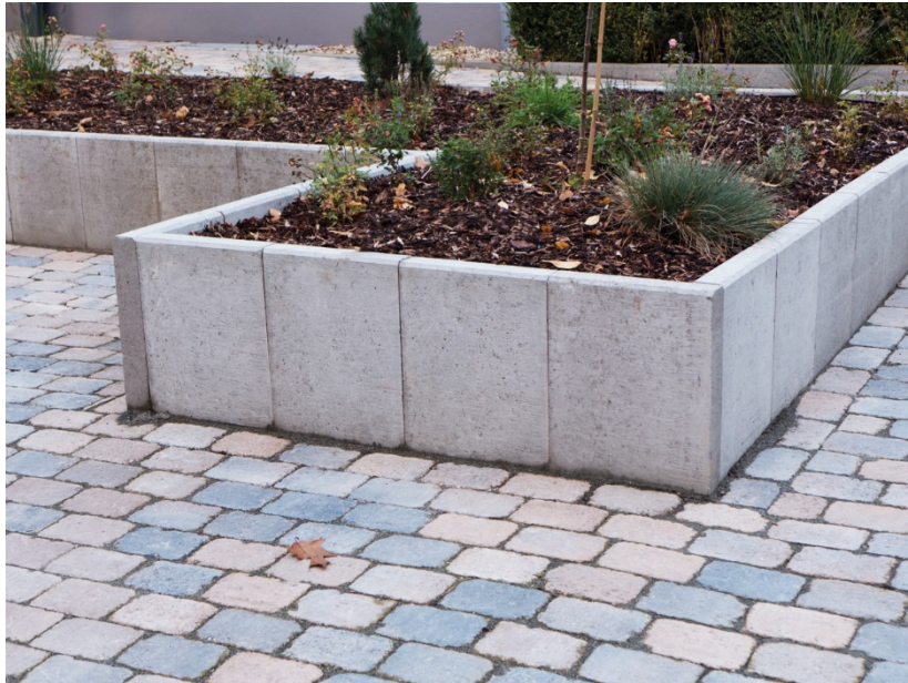
80 x 45 x 40 x 8 cm Grau