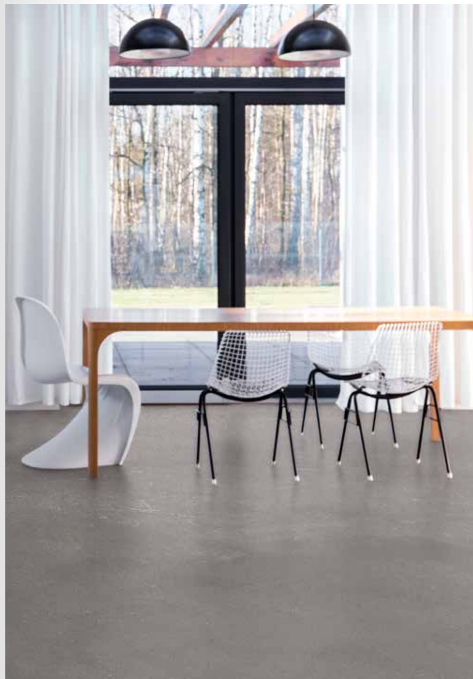
Boden mit Mask'fürBöden in Farbe Magma