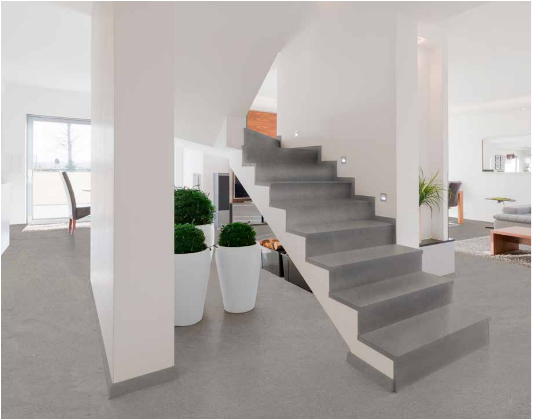
Boden und Treppe mit Mask´fürBöden in Farbe Zink

Böden und Treppen mit MASK´ FÜR BÖDEN einheitlich gestalten!