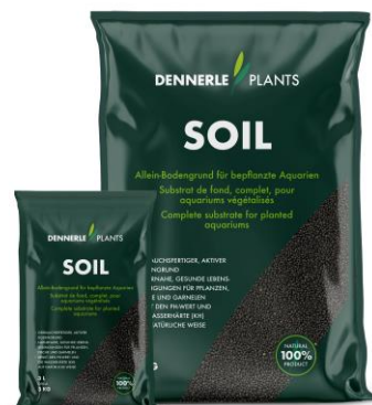
Perfekt für Wabi Kusa: DENNERLE Plants SOIL