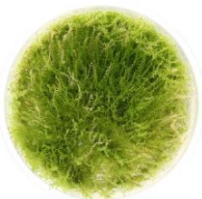
10251575 2 x Amblystegium serpens In-Vitro (30305)