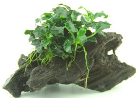
10590266 1 x Anubias nana 'Kirin Mini' auf Nanowood (30500)