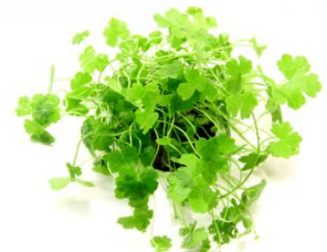
10451211 1 x Hydrocotyle tripartita 'Mini' In Vitro (30440)