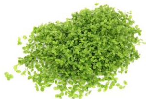
5583462 1 x Micranthemum tweediei im Topf (30033)