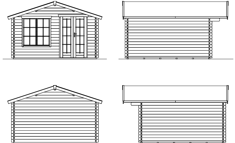
Grundriss, Schnitt und Ansichten M 1:100