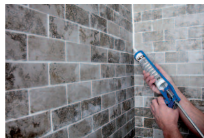
Durch den Einsatz von PCI Carraferm entstehen keine Randzonenverfärbungen bei Naturwerksteinen.