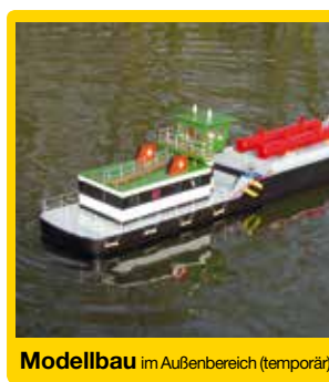
Modellbau im Außenbereich (temporär)