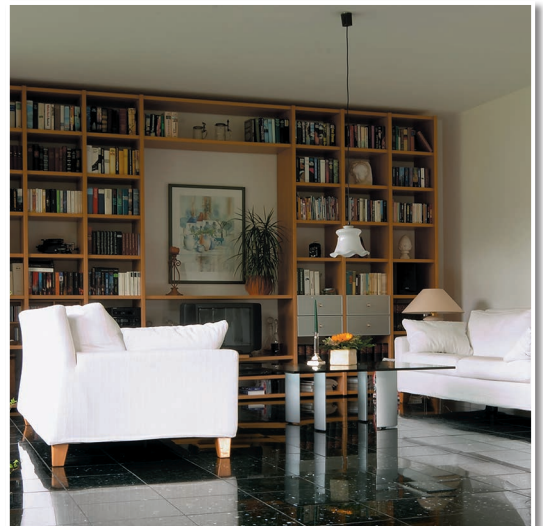
Granit im Wohnbereich. Verlegt mit den LUGATO Produkten für Marmor und Granit.